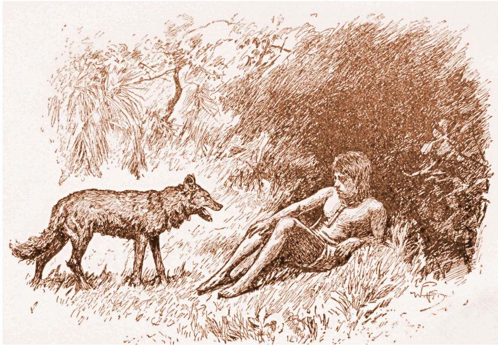
"ਉੱਠ ਛੋਟੇ ਭਰਾ ਮੈਂ ਖਬਰ ਲਿਆਇਆਂ ਹਾਂ"

"ਇਸ ਗੱਲ ਦੇ ਮੇਰੇ ਕੋਲ ਦੇ ਸ਼ਬਦ ਨੇ ॥ ਮੈਂ ਭੀ ਇਕ ਛੋਟਾ ਜਿਹਾ ਵਾਇਦਾ ਕੀਤਾ ਹੈ ॥ ਮਗਰ ਖਬਰ ਹਮੇਸ਼ਾ ਅੱਛੀ ਹੁੰਦੀ ਹੈ ॥ ਅੱਜ ਰਾਤ ਮੈਂ ਬੜਾ ਥੱਕਿਆ ਹੋਇਆ ਹਾਂ - ਨਵੀਆਂ ਚੀਜ਼ਾਂ ਨਾਲ ਬੜਾ ਥੱਕਿਆ ਹੋਇਆ ਹਾਂ । ਸਲੇਟੀ ਭਰਾ - ਪਰ ਹਮੇਸ਼ਾ ਮੇਰੇ ਵਾਸ਼ੇ ਖਬਰਾਂ ਲਿਆਇਆ ਕਰ ॥"