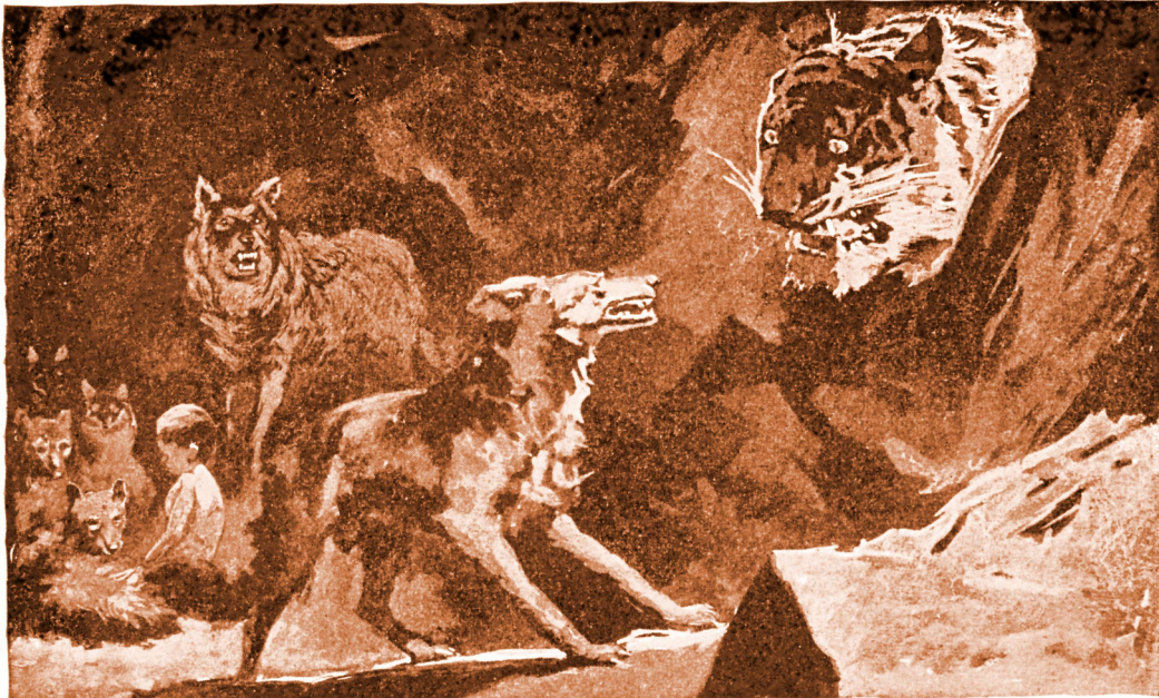
"ਚੀਤੇ ਦੀ ਢਾੜ ਨੇ ਗੁਫਾ ਨੂੰ ਗੜਗੜਾਹੂ ਨਾਲ ਭਰ ਦਿਤਾ"

ਸ਼ੇਰ ਖਾਂ ਨੇ ਇਕ ਲੱਕੜਹਾਰੇ ਦੀ ਬਾਲੀ ਯੂਈ'ਚ ਛਾਲ ਮਾਰੀ ਸੀ । ਜਿਵੇਂ ਪਿਤਾ ਬਘਿਆੜ ਨੇ ਦੱਸਿਆ ਸੀ । ਅਤੇ ਅਪਨੇ ਪੈਰ ਬਲਣ ਦੀ ਦਰੂ ਕਰਕੇ ਬੜਾ ਗੁੱਸਾਇਆ ਹੋਇਆ ਸੀ ॥ ਪਰ ਪਿਤਾ ਬਘਿਆੜ ਜਾਣਦਾ ਸੀ ਕਿ ਗੁਫਾ ਦਾ ਮੂੰਹ ਇਕ ਚੀਤੇ ਦੇ ਅੰਦਰ ਆਉਣ ਵਾਸਤੇ ਕਾਫੀ ਛੋਟਾ ਸੀ ॥ ਜਿੱਥੇ ਸ਼ੇਰ ਖਾਂ ਸੀ । ਇਥੇ ਮੋੱਢੇ ਅਤੇ ਅਗਲੇ ਪੰਜੇ ਘਟੂ ਜਗ੍ਹਾ ਹੋਣ ਕਰਕੇ ਕੜਵੱਲੇ ਹੋਏ ਸੀ । ਜਿਵੇਂ ਇਕ ਆਦਮੀ ਦੇ ਹੋਣਗੇ ਜੇ ਉਹ ਇਕ ਪੀਪੇ'ਚ ਪਿਆ ਲੜਨ ਦੀ ਕੋਸ਼ਿਸ਼ ਕਰੇ ॥