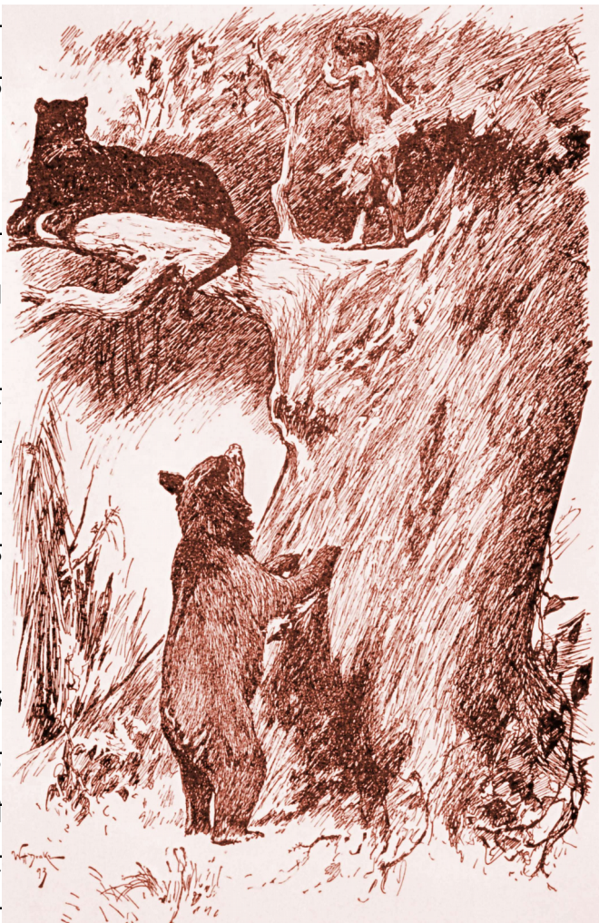
"ਬਘੀਰਾ ਇਕ ਟ੍ਰਾਈ ਤੇ ਲੰਮਾ ਪੈਕੇ ਅਵਾਜ ਮਾਰਦਾ ਆ ਜਾ ਛੋਟੇ ਭਰਾ"

ਮਾਤਾ ਬਘਿਆੜ ਨੇ ਇਕ ਜਾਂ ਦੇ ਵਾਰ ਉਨੂੰ ਦੱਸਿਆ ਸੀ ਕਿ ਸ਼ੇਰ ਖਾਂ ਵਰਗੇ ਜੀਆਂ ਤੇ ਭਰੋਸਾ ਨਹੀਂ ਕੀਤਾ ਜਾ ਸਕਦਾ । ਅਤੇ ਕਿਸੇ ਦਿਨ ਉਸ ਨੂੰ ਸ਼ੇਰ ਖਾਂ ਨੂੰ ਜਰੂਰ ਮਾਰਨਾ ਪਏਗਾ ॥ ਪਰ ਇਕ ਜਵਾਨ ਬਘਿਆੜ ਨੂੰ ਇਹ ਮਸ਼ਵਰਾ ਹਰ ਵਕੂ ਯਾਦ ਰਹਿੰਦਾ । ਪਰ ਮੁਗਲੀ ਇਹ ਭੁੱਲ ਗਿਆ ਕਿਉਂਕਿ ਉਹ ਇਕ ਮੁੰਡਾ ਸੀ - ਮਗਰ ਅਪਨੇ ਆਪ ਨੂੰ ਉਹ ਜਰੂਰ ਬਘਿਆੜ ਅਖਵਾਉਂਦਾ ਜਿਹ ਉਹ ਕਿਸੇ ਇਨਸਾਨੀ ਜਬਾਨ'ਚ ਬੋਲ ਸਕਦਾ ॥