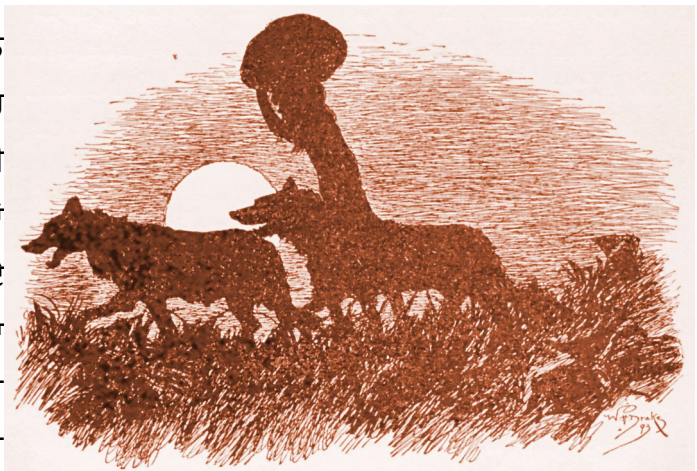
"ਜਦੋਂ ਮਦਾਨ ਚ ਚੰਨ ਚੜ੍ਹਿਆ ਪੰਡੂਆਂ ਨੇ ਮੁਗਲੀ ਨੂੰ ਦੁੜਕੀ ਚਾਲ ਚ ਟੁਰਦਿਆਂ ਵੇਖਿਆ । ਅਤੇ ਦੋ ਬਖਿਆੜ ਉਧੇ ਮਗਰ ਸੀ ॥"

ਜਦੋਂ ਮਦਾਨ ਤੇ ਚੰਦ੍ਰਮਾਂ ਚੜ੍ਹਿਆ । ਸਭ ਕੁਝ ਦੁਧ ਵਰਗਾ ਚਿਟ੍ਰਾ ਦਿਖਨ ਲਗ ਪਿਆ । ਡਰੇ ਹੋਏ ਪੰਡੂਆਂ ਨੇ ਮੁਗਲੀ ਨੂੰ ਸਿਰ ਤੇ ਇਕ ਪੰਡ ਚੁੱਕੀ । ਦੋ ਬਖਿਆੜਾਂ ਨੂੰ ਉਧੇ ਮਗਰ ਤੇਜੀ ਨਾਲ ਟੁਰਦੇ ਹੋਏ ਉਸ ਚਾਲ ਚ ਵੇਖਿਆ । ਜਿੜੀ ਬਖਿਆੜ ਚਾਲ ਲੰਮੇ ਮੀਲ ਅਗੂ ਵਾਂਗ ਖਾ ਜਾਉਂਦੀ ਹੈ ॥ ਤਾਂ ਫੇਰ ਓਨ੍ਹਾਂ ਨੇ ਮੰਦਰ ਦੀਆਂ ਟੱਲੀਆਂ ਤੇ ਸ਼ੰਖ ਇਨ੍ਹੇ ਜੇਰ ਦੇ ਵਜਾਏ ਕਿ ਜਿਨ੍ਹੇ ਅੱਜ ਤਾਂਈ ਨਹੀਂ ਸੀ ਵਜਾਏ ॥ ਅਤੇ ਮਸੂਆ ਰੋਈ । ਅਤੇ ਬਲਦੇਵ ਨੇ ਅਪਨੀ ਜੰਗਲ ਦੀ ਜਾਂਬਾਜੀ ਦੀ ਕਹਾਣੀਆਂ ਦੀ ਕਢਾਈ ਕੀਤੀ । ਜਦ ਤਕ ਕਿ ਓਨ੍ਹੇ ਕਹਾਣੀ ਇਹ ਕਹਕੇ ਖਤਮ ਨਾਂ ਕੀਤੀ ਕਿ ਕਲ੍ਹਾ ਅਪਨੇ ਪਿਛਲੇ ਪੈਰਾਂ ਤੇ ਖੜਾ ਹੋਕੇ ਆਦਮੀਆਂ ਵਾਂਗ ਬੋਲਿਆ ॥