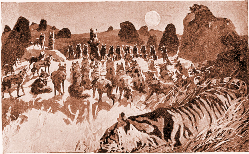
"ਪੰਚਾਇਤੀ ਥੜੇ ਤੇ ਬੈਠਕ"

ਕਲੇ ਨੇ ਅਪਨਾ ਸਿਰ ਪੰਜਿਆਂ'ਤੋਂ ਉਚ੍ਰਾ ਨਹੀਂ ਚੁੱਕਿਆ । ਪਰ ਇਹ ਹੀ ਕਹਿੰਦਾ ਰਿਹਾ : "ਚੰਗੀ ਤਰ੍ਹਾਂ ਵੱਖੇ !" ਇਕ ਦਬੀ ਹੋਈ ਅਵਾਜ਼ ਥੜੇ ਦੇ ਪਿੱਛੋਂ ਆਈ - ਸ਼ੇਰ ਖਾਂ ਦੀ ਰੋਂਦੀ ਹੋਈ ਅਵਾਜ਼ : "ਇਹ ਬਲੂੰਗੜਾ ਮੇਰਾ ਹੈ ॥ ਇਸ ਨੂੰ ਮੈਨੂੰ ਦੇ ਦਿਓ ॥ ਅਜਾਦ ਲੋਕਾਂ ਨੇ ਇਕ ਆਦਮੀ ਦੇ ਬਲੂੰਗੜੇ ਦਾ ਕੀ ਕਰਨਾ ਹੈ ?" ਕਲੇ ਨੇ ਕਦੀਂ ਅਪਨੇ ਕਨ੍ਹ ਨਹੀਂ ਸੀ ਫੜਕਾਏ ॥ ਸਿਰਫ ਇਨ੍ਹਾ ਹੀ ਕਿਹਾ ਸੀ : "ਚੰਗੀ ਤਰ੍ਹਾਂ ਵੱਖੇ ਓਹ ਬਘਿਆੜੇ ! ਅਜਾਦ ਲੋਕਾਂ ਦਾ ਕਿਸੇ ਹੋਰ ਦੇ ਹੁਕਮ ਬਾਰੇ ਕੀ ਕਰਨਾ ਹੈ ਸਿਰਫ ਅਜਾਦ ਲੋਕਾਂ ਦੇ ਹੁਕਮ ਦੇ ਬਜਾਏ ? ਚੰਗੀ ਤਰ੍ਹਾਂ ਵੱਖੇ !"